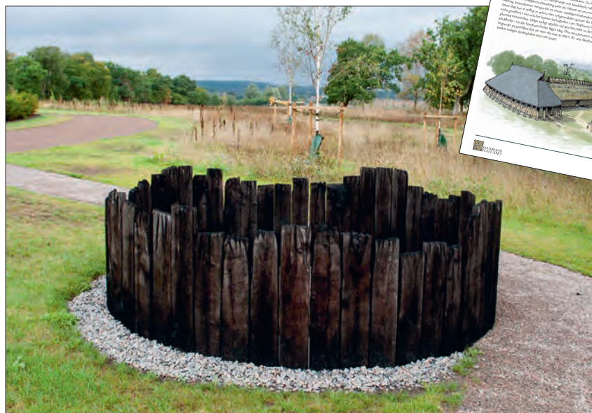
Figur 2. Skylten (infälld) och brunnen på den nya delen "Ängskyrkogården" vid Söndrums kyrka. Springbrunnen porlar stilla där den vikingatida brunnen fanns, som en liten hälsning från någon som levde här en gång för mycket länge sedan.

Allahelgonahelgen 2017 invigdes den nya delen av Söndrums kyrkogård. I namntävlingen segrade förslaget Ängskyrkogården. Med i planerna för utformningen av den nya kyrkogårdsdelen fanns förslaget att försöka bevara den vikingatida brunn som hittades vid den arkeologiska undersökningen. Men liksom fallet var när brunnen grävdes ur, så fortsatte den att producera för mycket vatten. Vid utgrävningen sökte vi lösa situationen genom att använda pumpar och gräva kanaler att leda bort vattnet i. Vid anläggandet av den nya kyrkogårdsdelen då dräneringen var klar och den naturliga alven var utbytt mot sand som schaktats dit från kvarteret Borgen på Söder i Halmstad, byggdes istället en konstgjord källa på samma ställe som brunnen funnits. I Hallandspostens inslag om invigningen citeras arkitekt Pål Reijer "Den är inramad med brända ekplank, precis som det såg ut vid den arkeologiska utgrävningen" (HP 2016-11-06 Anders Holmer). Vapnö-Söndrums församling inkom även med en beställning av en informationsskylt att sättas upp invid källan. Kulturmiljö Halland producerade skylten där projektledare Stina Tegnhed skrev texten och layoutare Anders Andersson stod för formgivningen och tecknade en illustration över Trelleborgshuset och brunnen.