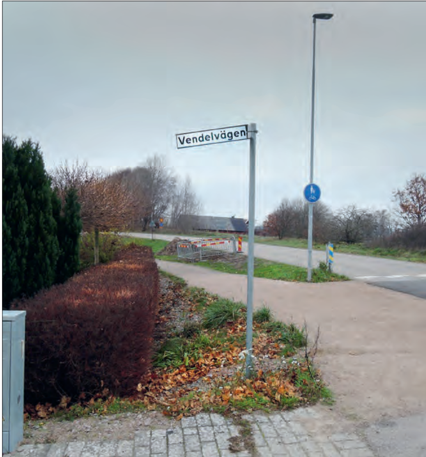
Figur 4: Vendelvägen – minner om platsens vendel- och vikingatida anor.

Ytterligare ett fint exempel på hur kunskapen från undersökningsresultaten förvaltats och lever kvar är valet av gatunamn. Där boplaten RAÄ 98:2 och delar av gravfältet RAÄ 5 en gång fanns löper nu Vendelvägen genom det nya bostadsområdet.