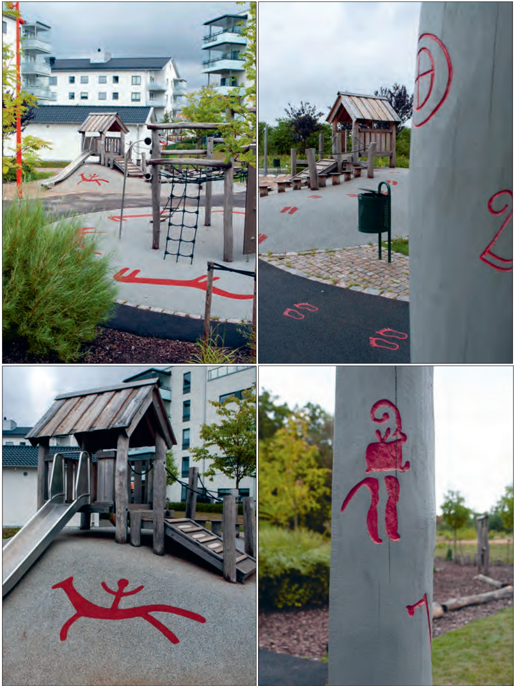
Figur 1. Lekplats med lite Bronsåldersfeeling i det nybyggda bostadsområdet Albinsro.